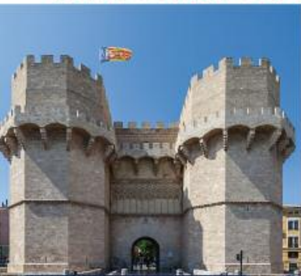
Torres de Serranos

VISITA GUIADA POR EL CENTRO HISTÓRICO DE VALENCIA