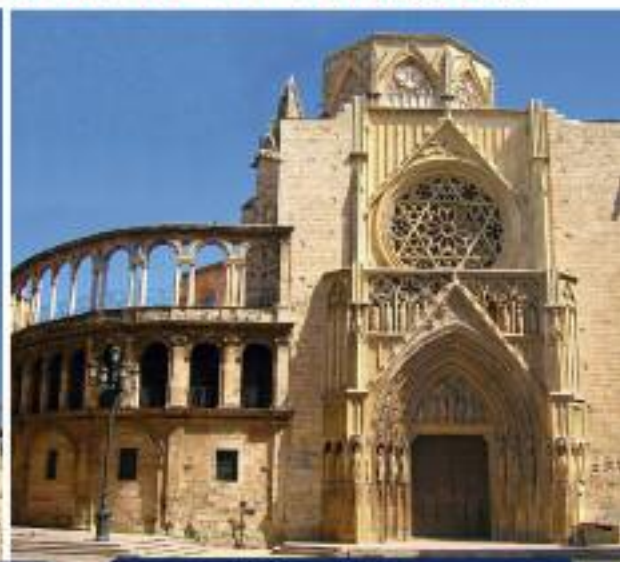
Catedral de Sta. María